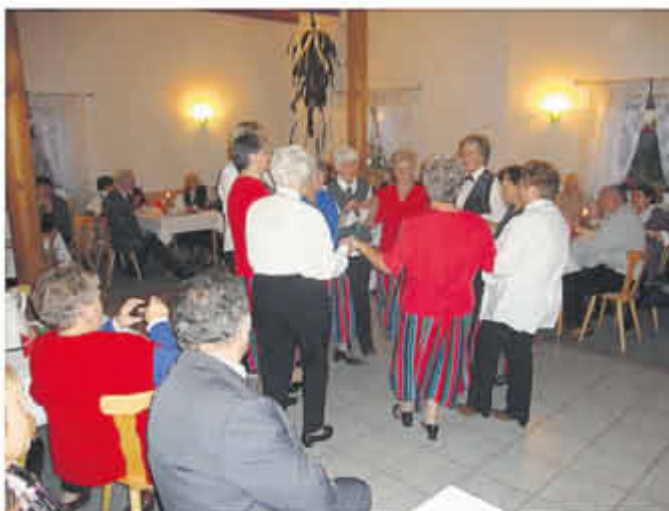
Broderstorfer Tanzgruppe mit "Wochenend und "Sonnenschein"