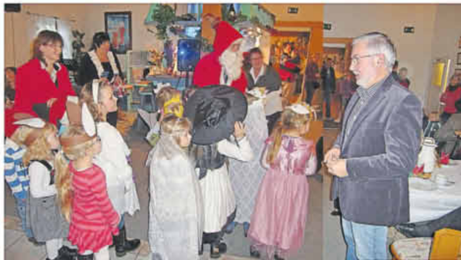
Der Bürgermeister dankte allen und wurde vom Weihnachtsmann aufgefordert ein Gedicht aufzusagen