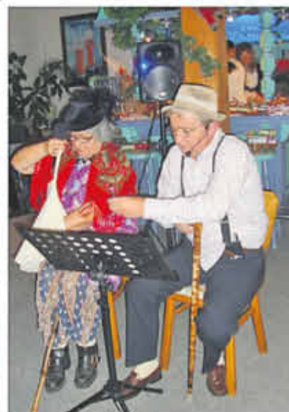
Familie Muschinski erfreute mit lustigen Sketschen