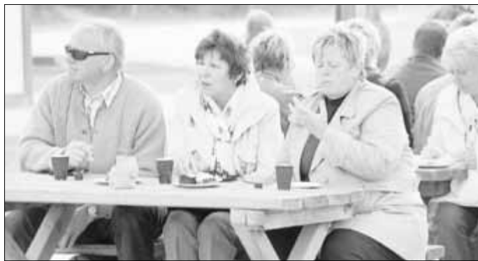
An der Kaffeetafel wurde es gemütlich